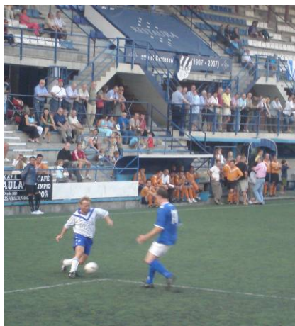
Arturo fent de les seves